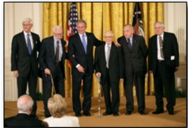
15. November 2007