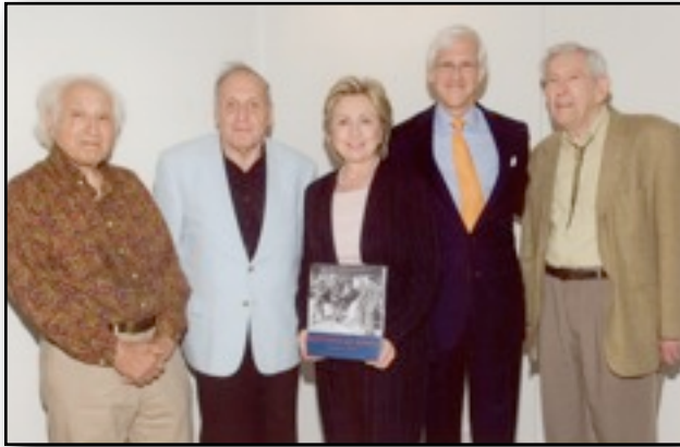
5. Juni 2007