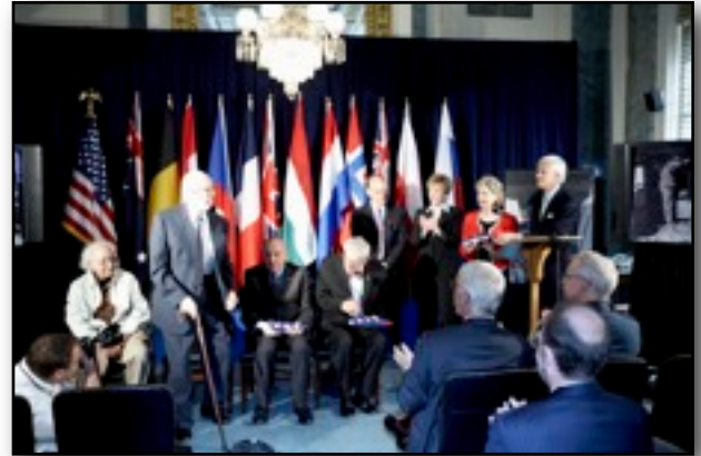
6. Juni 2007