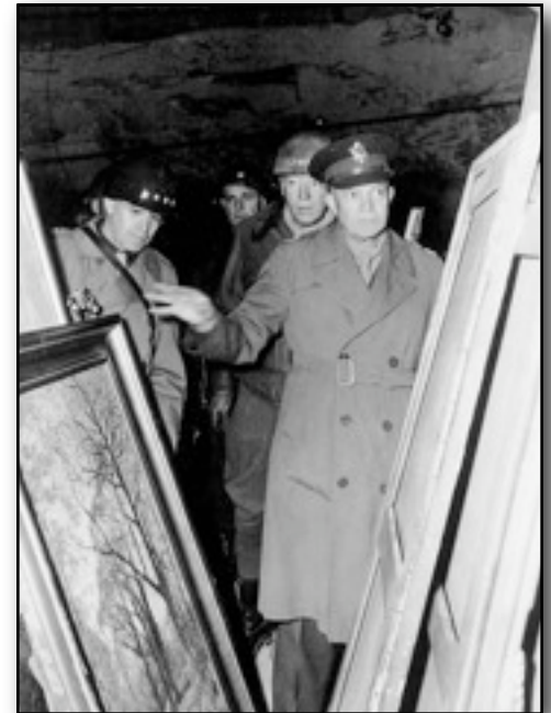
General Bradley, General Patton und General Eisenhower untersuchen deutsche Museumsschätze, die am 12. April 1944 in einem Bergwerk in Merkers gefunden wurden.

Die Kommandanten im Feld und die Koordinatoren der Luftbombardierungsmissionen waren von nun an gehalten Analysen möglicher Schäden kultureller Güter durchzuführen, um Italiens tausende von Kirchen, Klöster und andere Denkmäler nicht in Gefahr zu bringen.