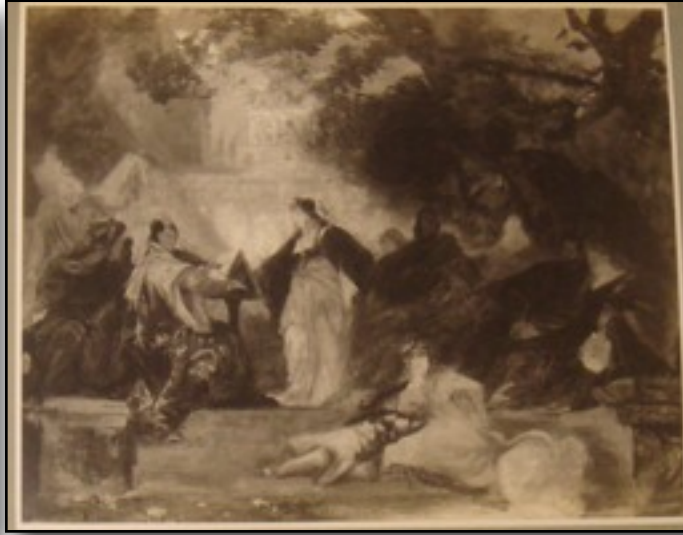
Album XIII; eine der Fotografien eines Gemäldes in Album XIII, Siesta am Hofe der Medicis, ist erst im Jahre 2009 seinen rechtmäßigen Eigentümern durch die Bundesrepublik Deutschland zurückerstattet worden.

Am 18. Mai 2010 wird die formelle Übergabe von Gemäldegalerie Linz Album XIII durch Robert M. Edsel, dem Vorsitzenden der Monuments Men Foundation, an das Deutsche Historische Museum in Berlin erfolgen. Damit wird die Heimreise des Albums aus Ohio, USA abgeschlossen sein. Dort wurde es Ende des Jahre 2009 im Besitz eines Veteranen der US Armee wiederentdeckt.