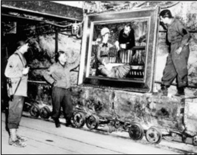
Edouard Manets Gemälde „Im Wintergarten“ wurde im April 1945 in einem Bergwerk in Merkers gefunden. Die „Monuments Men“ gaben es nachfolgend dem Kaiser-Friedrich Museum in Berlin zurück. Heute wird es in der Alten Nationalgalerie in Berlin ausgestellt.